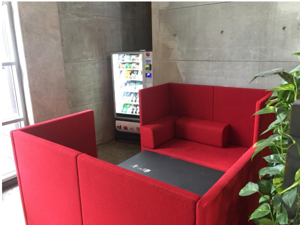
室內有很多沙發區提供休息