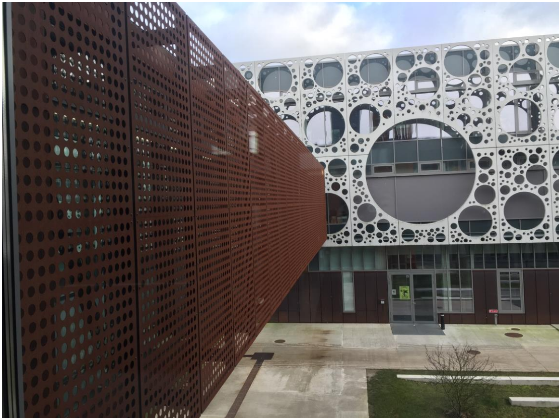
工程大樓外觀大家都說這是 Bubble house 或是 Cheese house