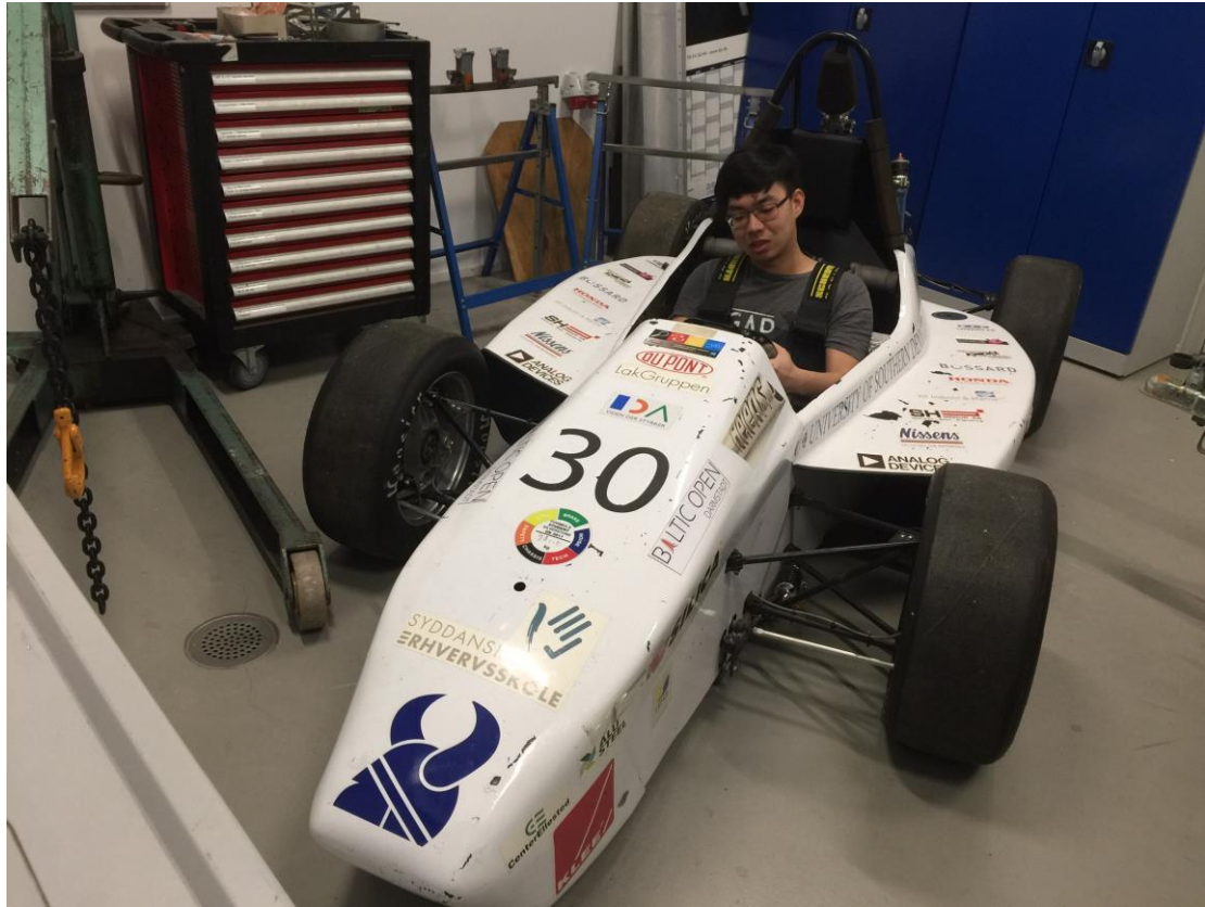
量測實驗車的煞車踏板行程